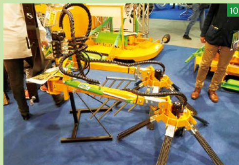
▲この作業機はなんだ?! イタリア・SALF社製の「ほうき」である。果樹園で樹木を傷めないように落葉を集めたり、草刈り後の掃除に使うのだろう。トラクターから油圧で動力を受けて、回転する仕組みだ。メーカーによって特徴のある便利な道具が揃っていて、見ているだけでもワクワクする