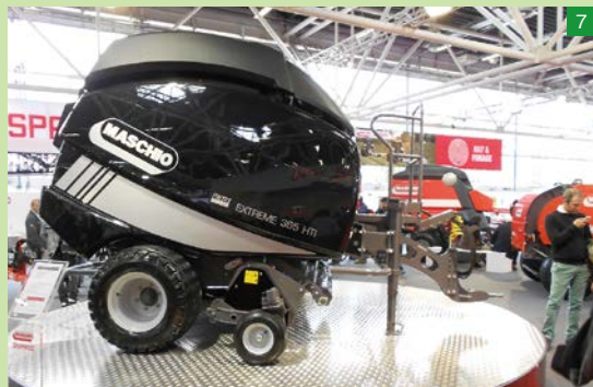
◀酪農分野の作業機も豊富なラインナップが展示されていた。MASCHIOのロールベアラー、最新機種は丸みを帯びたデザインでスタイリッシュで従来よりコンパクトだ。この機種は牽引タイヤが幅広く、踏圧を下げる工夫も見られる