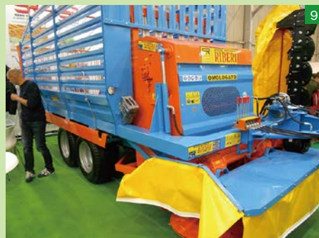
▲イタリア・Riberi社のモアー&集草トラック。牽引式で、モアーで草を刈り取った後、そのまま集草して後方のコンテナに放り込む。このアイデアはメーカーの技術者が発案したのか、農業者の要望で商品化されたのか、興味が湧いた。現地でカタログをもらえなかったのが残念だ