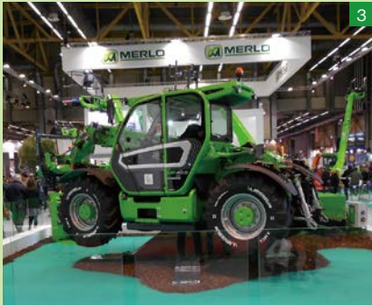
▲MERLO社のテレハンドラータイプのトラクター。高所作業に対応可能なアタッチメントだけでなく、後部に3点リンク機構が搭載されているのがおもしろい。アタッチメントの選択次第で、さまざまな作業を一台でこなせそう