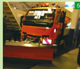
▲融雪剤散布用のトラック。前方に角度を調節できる除雪用の排土板を装着し、融雪剤散布用のブロードキャスターが荷台に載っている。タイヤが華奢に思えたが、実用的である