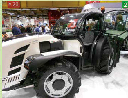
▲ランボルギーニの中折れタイプのトラクター。前後輪同サイズのタイヤは駆動力の伝達ロスが小さいのが利点だ。同サイズのタイヤは摩耗度合によって位置を変えたり、交換部品が一つで済んだりするので便利だろう