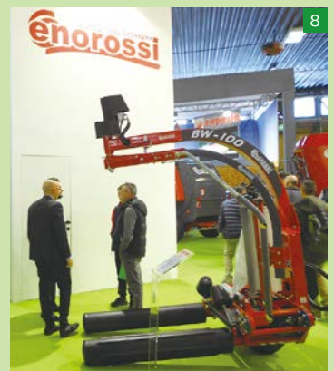
▲こちらも酪農向け作業機。イタリア・Enorossi社のラッピングマシン。このようなタイプは、国内で見たことがない。ラップ後のロールの移動作業や圃場でのラッピング作業に適していると思う