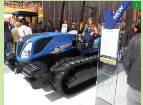
▲ニューホランドのキャビンなしフルクローラトラクター。日本国内では取り扱っていないが、気になる1台。現地ではどのような場面で活躍するのか……ユーザーと現場で話してみたい

▶イタリア・TF di Fattori社のトレーラー。安全基準や交通ルールが日本と違うのだろう。トラクターやトラック、運搬用トレーラーにはさまざまなタイプがあり、圃場作業、圃場周辺作業、農道、公道とあらゆるシーンに対応できる最適一台を選べる状態だ。うらやましい!!