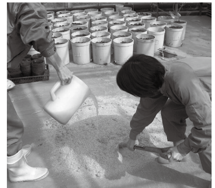
写真2：ゼオライトぼかしの製造作業

もう一つの上手な使い方が、堆肥やぼかし肥への混合だ。家畜ふん堆肥を作る際に、この粉状のゼオライトを10%程度混ぜると、家畜ふんが分解して発生するアンモニアをゼオライトが吸着して、悪臭を抑えることができ、水分調節材にもなる。「ゼオライト堆肥」に吸着されたアンモニウムイオン