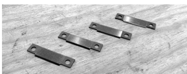
写真4：完全なる代替品を作ることができた。実は僕はこの案件に主体的に関与したわけではない。チームの力で解決したこと、それが嬉しかった！