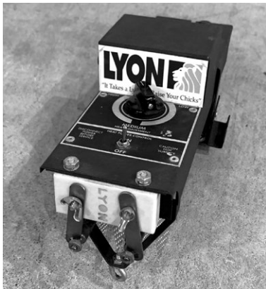
写真1：LYON technology社のデビーカー（電気加温式切嘴器）

場では、鶏同士が嘴でつついて傷付け合うことを防ぐために、ひなの段階で嘴を切断するんですね。一日に何千羽も処理するとデビーカーの刃が歪曲してしまうので、消耗部品として交換するのですが、刃の在庫が尽きそうに焦っているとのこと。