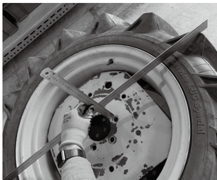
写真2: ディスクからリムからタイヤまで完全に寸法を把握することが確実な仕事の第一歩