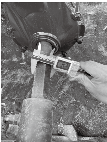
写真1: 田植機の寸法を隅々まで測っていく。悔いを残さぬよう心して測れ!

依頼——何度も行き来できないので、その場で始めましょう! まず実現したい輪距を聞いて、田植機のシャフトを測り、ホイールはリムの形状まで漏らさず測ります。必要な寸法はすべてiPhoneで撮ります。スマホを確認しながら、図面を描き起こし、詳細に設計していくわけです。「削り出す? 溶接する?」と製造条件を考えながら、「組み立て時に工具は届くか?」まで考える。部品の強度に迷えば近くのトラクターを見て参考に。これで失敗したら仕方ないと思えるまで考え尽くしたら、最後は図面通りに仕上げるだけですね。ドキドキしながら組み立てて、無事に機能すればひと安心! ということで! 今日も一丁あがり〜〜