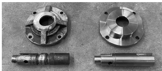
写真1：修復を依頼された摩耗したシャフト&フランジ(左)と、今回作り直したシャフト&フランジ(右)

日々の業務で何かと悩めば6に頼り、会社の備品に至るまで6を基準に決めるようになります。もはや6から離れられない脳になってしまいました