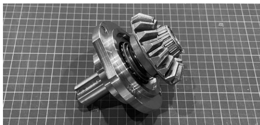
写真2：ミリ規格のオイルシールとインチ規格のベアリングが混在する不思議なユニットに。バッチリだ！