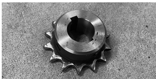
写真3：スプロケットも内径をミリ規格に追加工し、キマ溝は反対側に新たに削り直した