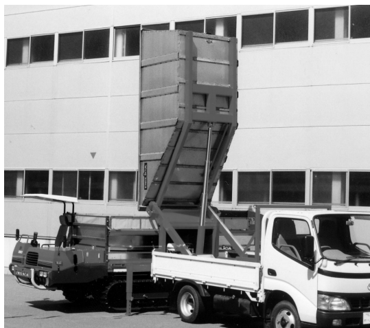
ダンプ支点が高く、角度は90度。 1回のダンプで堆肥を残さず降ろせる

これがあれば、大面積の圃場や離れた圃場でも高速で運搬でき、圃場にいるマニュアルスプレッダーの荷台に直接に積み込めるため、能率が大幅に向上する。（昆吉則）