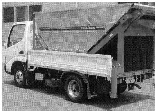
通常のトラック装着時