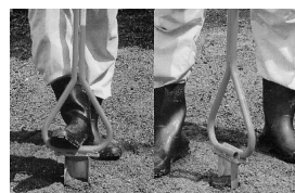
▲3 ゆっくり回転させながら引き上げると穴の周囲が崩れず、きれいな穴があげられる