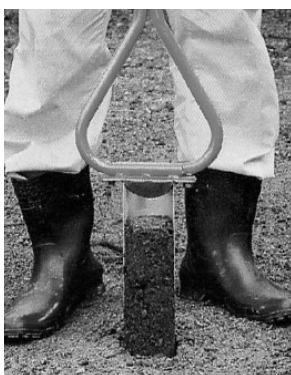
2 深くする場合はハンドルを左右に少し回転させ、再度踏みこむ