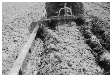
機体左に装着するタイプと組み合わせるとより効率的な作業が可能

ロータリ装着型と比べると作業スピードがはるかに速いだけでなく、高速作業であればこそスキによる溝作りがきれいに行なえる。さらに、本機の左側に装着するタイプを併用すると、圃場の四隅を除けばすべての畦を回り処理することも可能であり、残耕処理の所要時間も大幅に短縮できるはずだ。