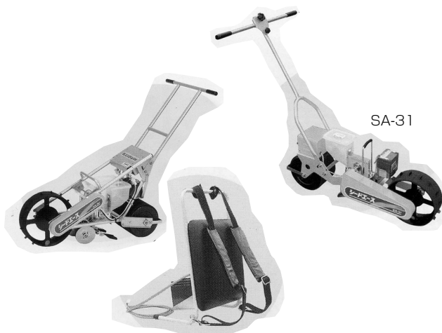
SA-32とバッテリー背負いユニット

希望小売価格 ……………SA-31：176,400円（税込み） SA-32：302,400円（税込み・ バッテリー背負いユニットは 別売で8,400円）