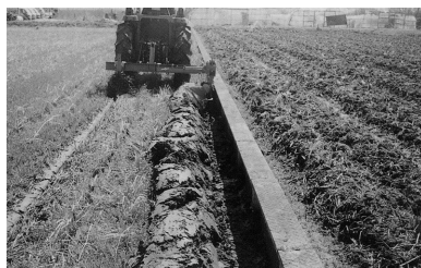
畦際処理とその溝

作業は、耕起前でもロータリ耕の後でも可能。処理された残耕部分はきれいな溝に成型される。また、オプションで水平保持のための尾ソリが付けられる。