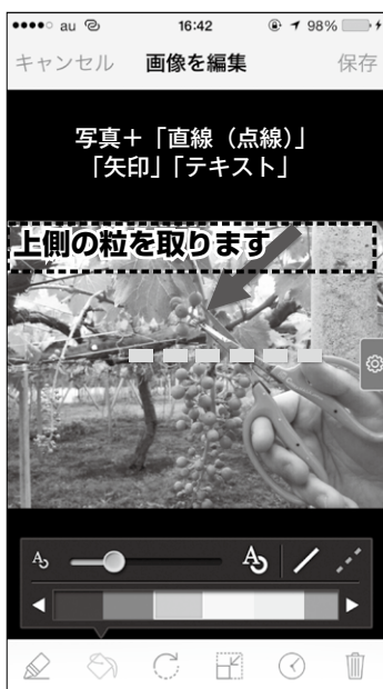
ブドウの摘粒する位置も矢印で示すとわかりやすい。