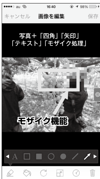
隠したい部分には指一本でモザイク処理。安心して写真を公開できる。

普段、農作物や農場などの様子を社員・スタッフに伝えるにはどのような方法をお使いですか？ 電話、メール、メッセージャー、社内シテム等々、たくさん方法があります。そのいずれの方法でもよく使うのが携帯、スマートフォン等で撮影した「画像」でしょう。今回はクラウドサービスとは離れますが、撮影した画像に簡単にキャプションや矢印を書き込めるツールをご紹介します。 これまではパソコン上で写真加工の専用ソフトなどをお使いだった方が多いかと思いますが。写真を撮って、パソコンに取り込み、ソフトを立ち上げて、プリントスクリーンをして……しんどい作業ですよ。 スマートフォンアプリの良い所は直感的に、操作ができることです。画面上の写真に指でなぞるだけで描画も、調整も簡単。撮影した現場で直ぐに、写真に文字を入れたり、丸で囲んだり、矢印をつけたりすることが出来ます。これらのアプリは他のサービス（メール、LINE、FBメッセージャー等）と連携しているので、保存せずに、作成した画像をそのまま送れるのです。 写真だけでは伝えづらい、だけど、いちいち加工するのは面倒くさいと思っっている方には、便利さを体験していただけたらと思います。